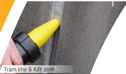
Trám khe & Kết dính